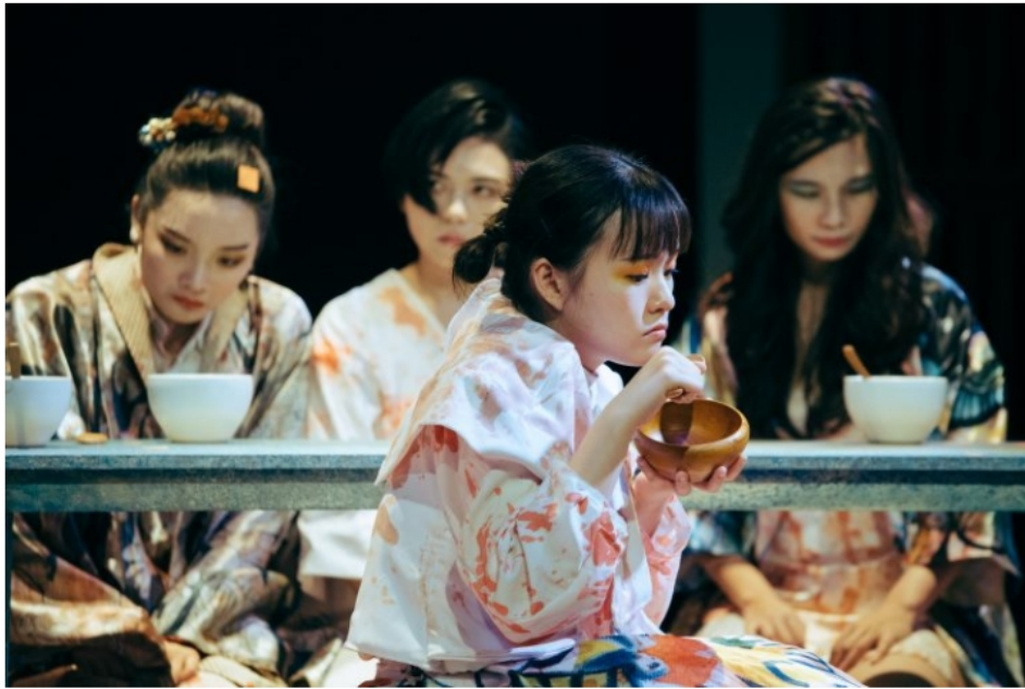
寺山修司來訪 / 狂人教育 台北場

進一步說，只有當狂人自身處於受迫害，或者說「被吃」的處境時，才能理解「吃人」意味著什麼！將這象徵符碼，置放在劇中人與偶之間的控制關係上，我們將發現：被控制的，往往不僅僅是個人之於體制的關係；而是人與人（家族中成員的相互猜忌與窺視，僅僅是一種社會縮影的隱喻）的拉扯與撕裂，形成比體制更龐然的隱藏性制約。換言之，將掌控內在於迫害意識上，是本劇小女兒說了大家都是騙子的真話後，象徵性地在門口（斷頭台意象）被砍頭的結果。這在戲的處理上，無疑令人印象深刻。因為，她是作為被迫害意識的一員，而發現真相；也因此被迫害的。這是意象在處理時的一種隱隱然，卻極具殺傷力的衝撞。那麼，誰謀害了說真話的小女兒呢？若從個人內在延伸到體制，則表現於戰後日本的資本管理社會下，沒落卻仍無限被供俸的天皇制，所象徵的國家懲戒性上。