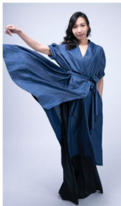
歡迎全校師生參與

演員、配音員及表演教師。2007 - 2009年在校期間以《紀念碑》《備忘錄》《婚姻場景》連續三年獲頒台藝大金獅獎最佳女主角，近年持續在大陸、香港等地巡迴演出；教學經驗豐富，在新店高中擔任表演藝術兼課教師長達六年，演出之餘也擔任表演指導，2015年開始以「No acting please」為題，在台北及台中散播表演藝術的種子。 近期劇場作品包括：人力飛行劇團《星光劇院》、《china 盜演》、《台北爸爸紐約媽媽》；非常林奕華《三國》、《賈費玉》；台南人劇團《Re/turn》、《木蘭少女》；表演工作坊《寶島一村》、《四把椅子劇團》《全國最多賓士車的小鎮住著三姐妹（和她們的 Brother）》、《0920002012》、《紀念碑》；同黨劇團-當代經典講劇節《三日雨》；想想人文空間《甜水版》等等。