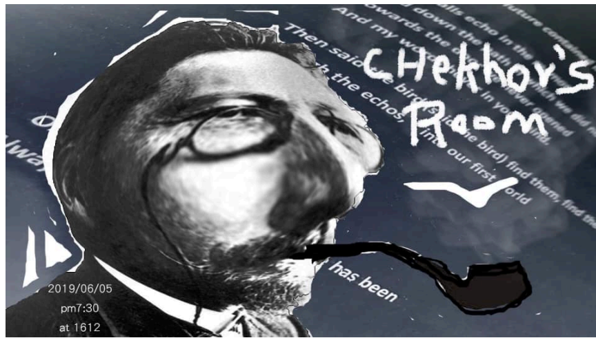
圖一 Open Studio 海報