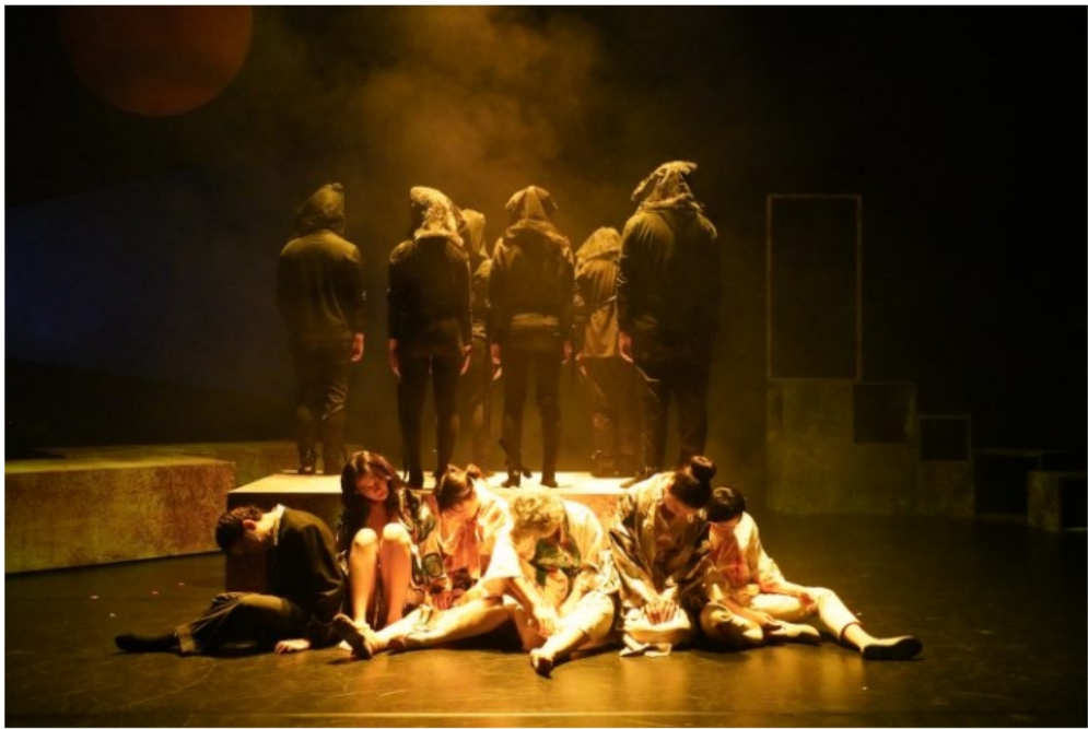
寺山修司來訪 / 狂人教育 台中場

「後設」情境的創作，拉出平行時空的結構，意圖鮮明，並藉此，將作者以一個腳色身分拉到觀眾面前。導演在處理先導神秘腳色——寺山修司本尊的出場上，維持過去在小劇場中的創作風格，凸顯身份敘事與獨白交錯的特質；同時不讓身體表現的形式美學，過度抽象取代人物內容的登場，有助於觀眾進入故事鋪陳。這樣的登場，其實架構在本劇的原初主題上：個人如何不在適應主流風潮下，仍保有被視作叛逆的自我 (ego)。也是在這樣的凝視與觀照下，導演維繫一貫風格，在詩的歧異性與戲劇的構造面間交錯開展，表現出闖入的寺山修司與當代亞洲戲劇前衛思潮的寺山修司間，如何度量人在意識、潛意識與超意識的衝撞。